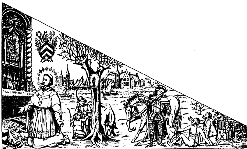
♦MDCXXXVII♦O.L.Vrouwe van Duffel ofte Van Goeden Wille ♦MGMXXXVII♦

Op 15 augustus 1937 werd door Kardinaal Van Roey de eerste steen gelegd voor de vergroting van de kapel. De werken werden evenwel pas in augustus 1939 gestart, en duurden tot 1 december 1942. Enkele jaren later, op 24 juli 1948, werd de kapel een parochiekerk.